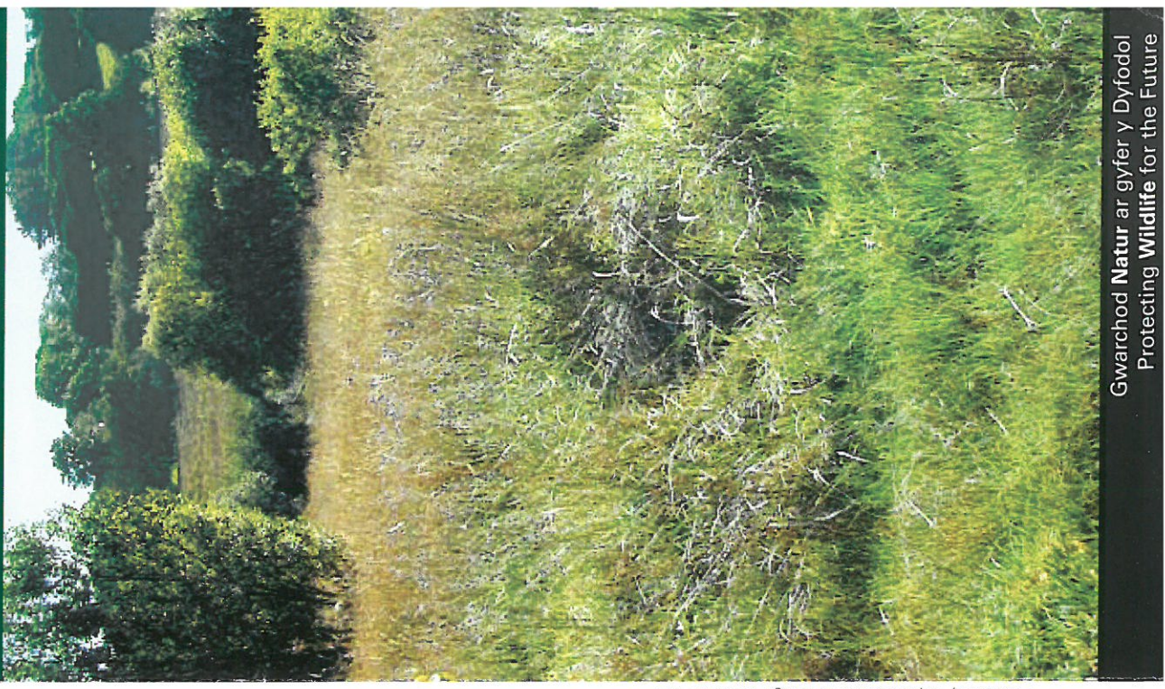
Produced by Fitzpatrick Woolmer Design - 01634 711 771