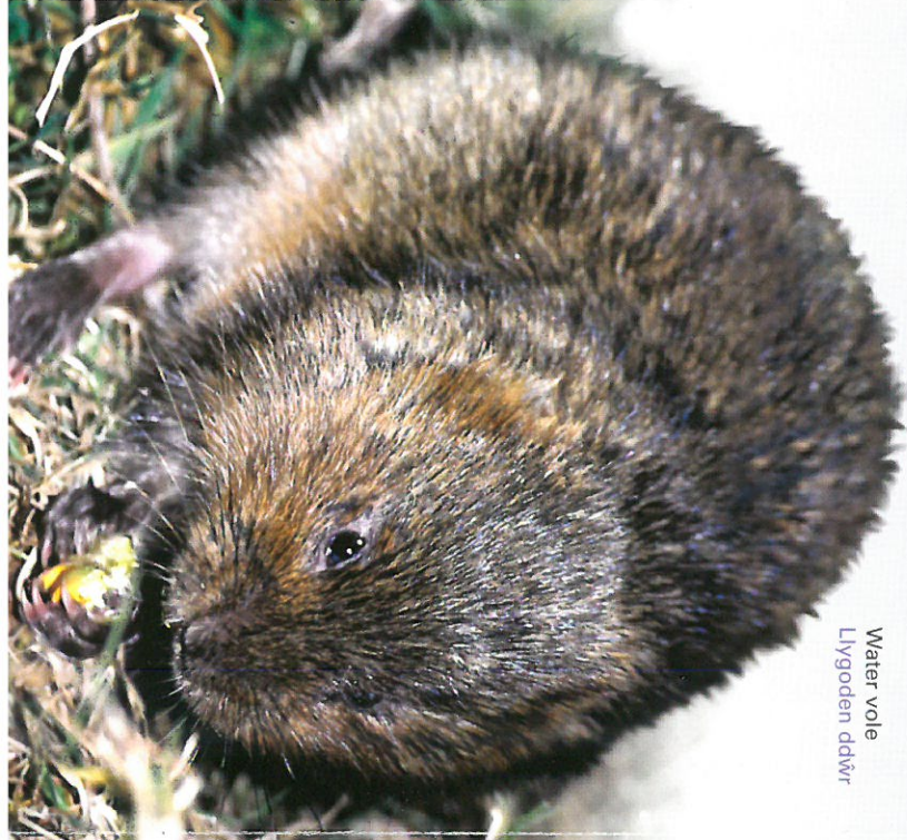
Water vole Lygoden ddir

Mae'r llygoden ddir yn rhywogaeth sy'n rhan o'r Cynllun Gweithredu Bioamrywiaeth Lleol (CGBL) yng Ngheredigion. Mae Ymddiriedolaeth Natur De a Gorllewin Cymru'n gweithio mewn partneriaeth gyda sefydliadau cadwraeth eraill yn y sir i helpu i sicrhau gwell dyfodol i'r rhywogaeth yn Rhos Fullbrook ac mewn manau eraill yn y sir. Am wybodaeth bellach am y Cynllun Gweithredu, cysylltwch â'r Ymddiriedolaeth Natur neu ewch am dro i'r dudalen ar yr arfordir a chefn gwlad yn www.ceredigion.gov.uk