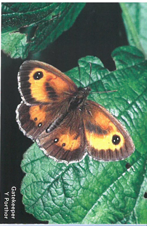
Gatekeeper Y Porthor