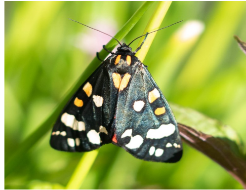
Gwyfyn y Teigr Ôl-adain Goch

Briwydd, Llau'r Offeiriaid ar gyfer y Gwalchwyfyn Hofran