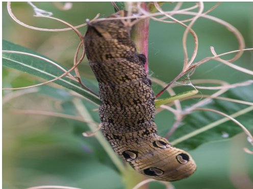
Lindysyn Gwalchwyfyn yr Helyglys

Mae planhigion bwyd ar gyfer rhai o rywogaethau lindys gwyfynod y DU yn cynnwys: